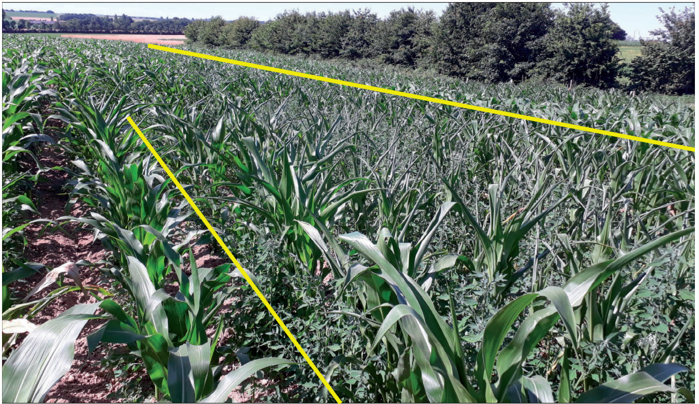
Binage avec disques butteurs : rang et inter-rang propres, feuilles déroulées.